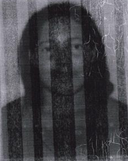
FOTO 3x4 CM

INSTITUTO DE IDENTIFICAÇÃO DR. ARIOLDO MENDES DE FAIVA